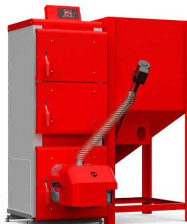
Q Pellet GL 30

HT-logic II Autoregulacja HT-Logic III zaprogramowana jest do mocy urządzenia, automatycznie dobiera parametry pracy oraz moduluje moc palnika w zależności od temperatury kotła co powoduje zmniejszenie ilości zużytego paliwa.